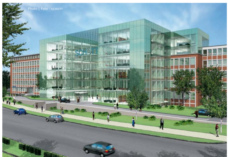
New face made of glass: SCHOTT will complete modernization of the administrative wing of its group headquarters in Mainz, the head office since 1952, by the end of 2009.

nehmen der SCHOTT AG, produziert wesentliche Komponenten für Photovoltaikanwendungen und Solarkraftwerke. In der Photovoltaikindustrie gehört das Unternehmen zu den wenigen integrierten Herstellern von multikristallinen Wafern (im Joint Venture WACKER SCHOTT Solar), Zellen und Modulen. Auch in der Dünnschichttechnologie zählt SCHOTT Solar zu den richtungsweisenden Unternehmen. Bei Solar- receivern sieht sich SCHOTT Solar als