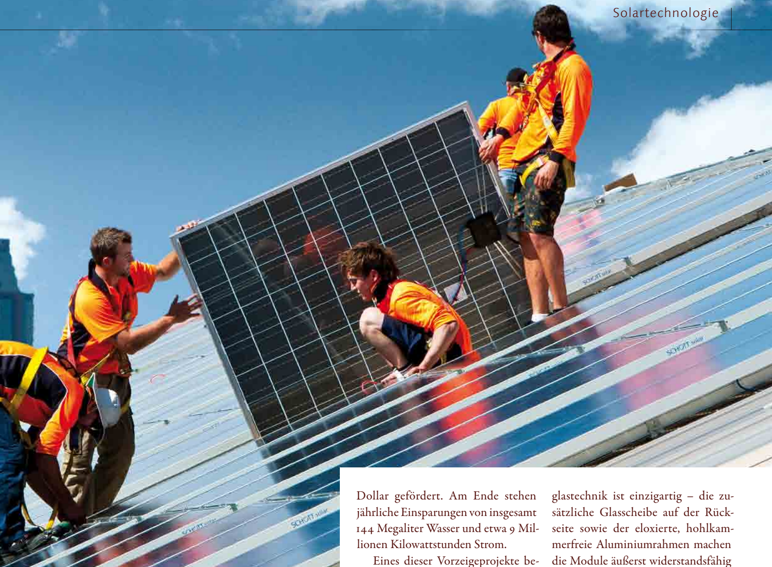
216 solar modules from SCHOTT on top of a former maintenance building near the harbor in Sydney convert sunlight into 100 MWh of power.

Über dem Hafen von Sydney: Auf einem ehemaligen Wartungsgebäude verwandeln 216 SCHOTT Solarmodule die Sonnenstrahlen in 100 MWh Energie.