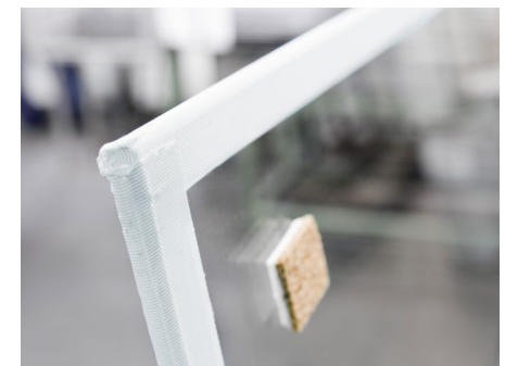
PYRAN® mit unbeschädigtem Kantenschutzband (weiß)