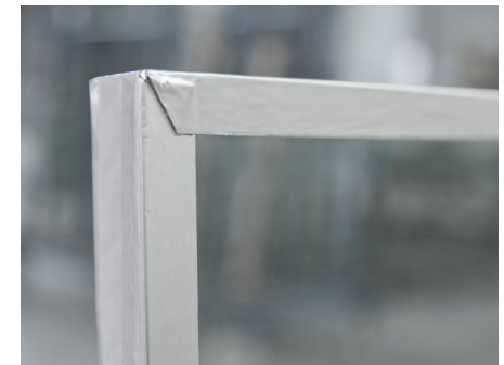
PYRANOVA® mit unbeschädigtem Kantenschutzband (silber)

Werden die Sicherheitsgläser entpackt und anderweitig gelagert, sind diese ausschließlich auf geeigneten Unterlagen abzustellen. Dabei ist darauf zu achten, dass die Kantenschutzbänder nicht beschädigt werden. Weiter sind die einzelnen Glaseinheiten durch geeignete Zwischenlagen voneinander zu trennen. Ein Abstellen der Sicherheitsgläser auf den Ecken ist nicht zulässig.