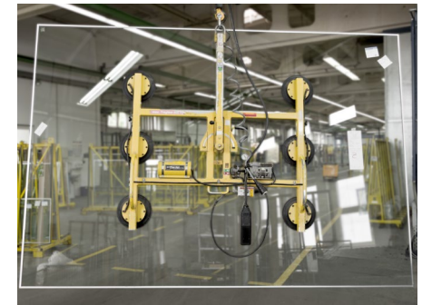
Ansaugstellen der Saugbatterie gleichmäßig über der Scheibenfläche verteilen

Der Transport der Sicherheitsgläser in Kräten und als Einzelscheiben hat mit geeigneten Hebe- und Transporteinrichtungen zu erfolgen. Beim Versetzen von Kräten mit Kran oder Stapler ist darauf zu achten, dass sich die Kräten stets in der Senkrechten zu ihrer Standfläche befinden und nicht auf Verwindung belastet werden. Beim Einsetzen von Saugbatterien ist darauf zu achten, dass die Ansaugstellen gleichmäßig über die Scheibenfläche der Sicherheitsgläser verteilt sind.