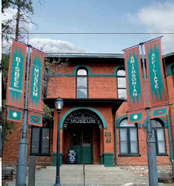
An exhibition at the Bisbee Mining & Historical Museum offers insights into the fascinating history of copper mining.