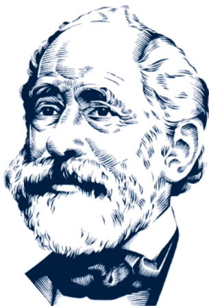
CARL ZEISS (1816 - 1888) Optician and precision mechanic. Founder of today's Carl Zeiss AG. Optiker und Feinmechaniker. Gründer der heutigen Carl Zeiss AG.