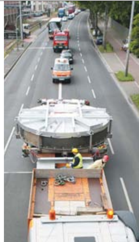
The journey progresses at a snail's pace on a main road that was closed.