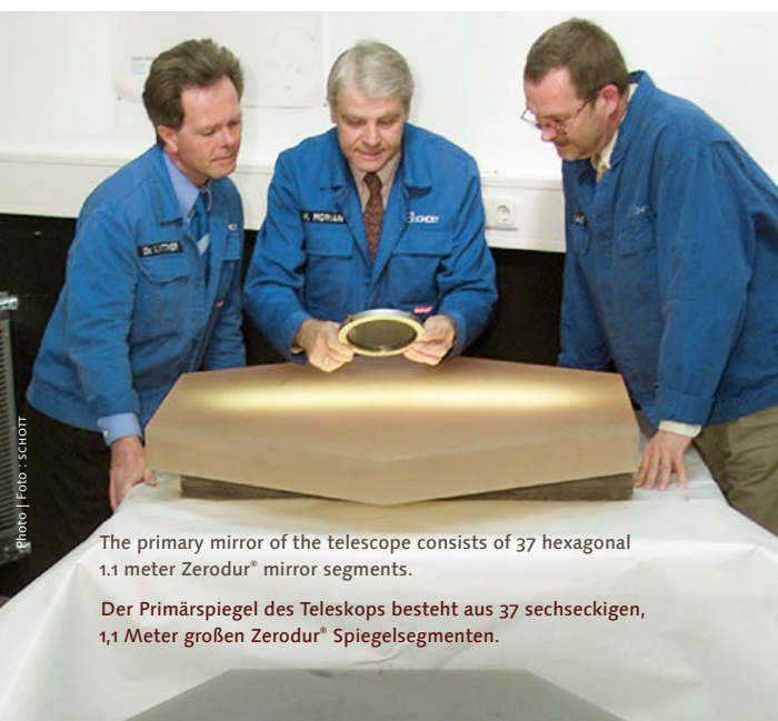
The primary mirror of the telescope consists of 37 hexagonal 1.1 meter Zerodur® mirror segments.

Eines scheint sicher: LAMOST wird die Erfolgsgeschichte der großen Himmeldurchmusterungen wie etwa des Sloan Digital Sky Survey (SDSS) erweitern und vertiefen. Die mit LAMOST aufgenommenen, vielen Millionen optischer Spektren werden für die beobachtende Kosmologie, für die Erforschung der Entstehung und Entwicklung von Galaxien und der Struktur des Milchstraßensystems sowie für die stellare Astrophysik eine neue Grundlage schaffen. <| marlene.deily@us.schott.com