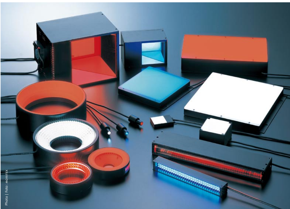
LED illumination systems offer solutions for various fields of industrial inspection. The "MG-Wave Series" is a next generation system family that features unique constant current sensing control, high luminous efficiency and reduced heat generation.

Das Streben nach Perfektion und einem Höchstmaß an Qualität hat in Japan eine lange Tradition. Vor diesem Hintergrund hat sich MORITEX seit 1973 einen Namen als Anbieter von Systemen zur visuellen Fertigungskontrolle erworben. Heute ist das Unternehmen in Asien Marktführer für LED-basierte und faseroptische Beleuchtungssysteme sowie optische Abbildungssysteme für die industrielle Bildverarbeitung – sogenannte Machine-Vision-Systeme. Stammsitz ist Tokio, wo MORITEX seit 2000 in der ersten Sektion der Börse gelistet ist. Das Unternehmen beschäftigt rund 450 Mitarbeiter in Japan, Singapur und China. In Europa sowie den USA ist MORITEX mit Vertriebsgesellschaften vertreten. Immer mehr Waren werden industriell gefertigt. Um hier den Überblick zu behalten, bedarf es ausgeklügelter Lösungen wie z. B. „Machine Vision Systems“ zur Steuerung und Kontrolle von Fabrikationsprozessen. Mit Lichtsystemen und Kameras steht ein Angebot zur Verfügung, das flexibel Kundenbedürfnissen angepasst werden kann. Das >