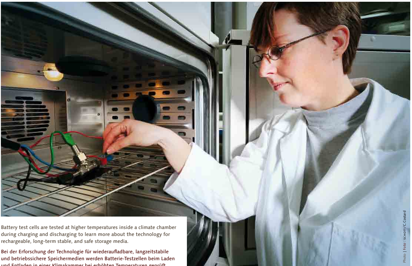
Battery test cells are tested at higher temperatures inside a climate chamber during charging and discharging to learn more about the technology for rechargeable, long-term stable, and safe storage media.