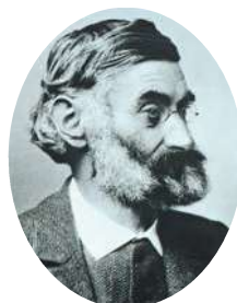
Ernst Karl Abbe, one of the founding fathers of SCHOTT Ernst Karl Abbe, einer der Gründerväter von SCHOTT

The German physicist and industrialist Ernst Karl Abbe (1840–1905) developed optical instruments in the second half of the 19th century. Together with Carl Zeiss and Otto Schott, he created the foundations for modern optics. Abbe was responsible for numerous calculation methods and microscopy techniques. In 1873, he discovered that light microscopes can no longer distinguish two objects from one another once their distance is less than half the light wavelength (200 nanometers). The Abbe Limit was born. Two years later, Abbe joined the company Carl Zeiss in Jena and became its sole owner in 1899. In 1884, he played a key role in the founding of today's SCHOTT AG.