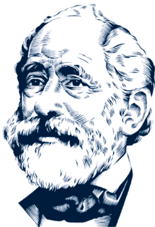
CARL ZEISS (1816 - 1888) Optician and precision mechanic. Founder of today's Carl Zeiss AG. Optiker und Feinmechaniker. Gründer der heutigen Carl Zeiss AG.