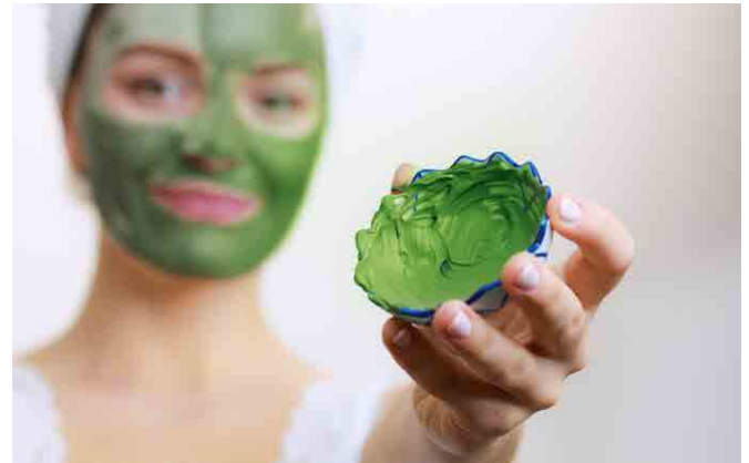
Algae are especially popular for the usage in cosmetics. They contain a high share of proteins, they can provide the skin with energy and protect it from draining. Algen werden gerne in der Kosmetik verwendet. Sie verfügen über einen hohen Anteil an Proteinen, die die Haut aktivieren und vor Austrocknung schützen.